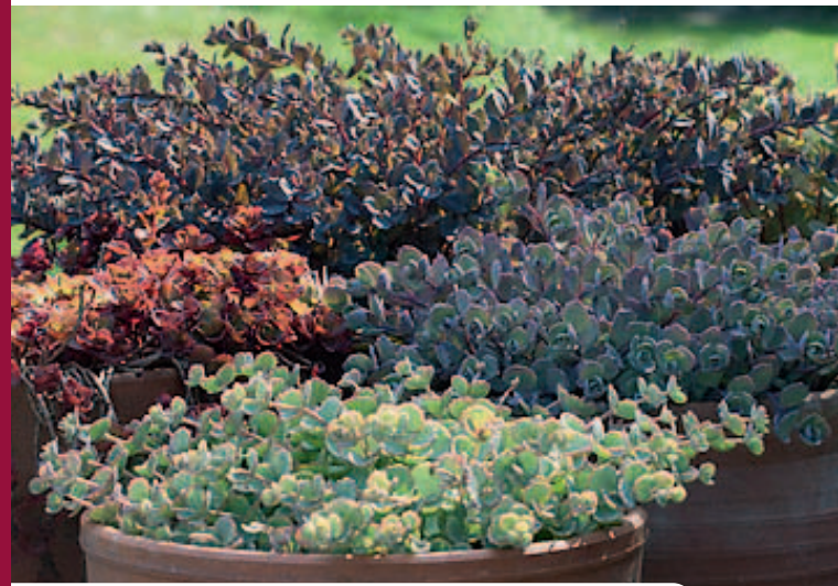
Für Sammler unwiderstehlich: Töpfe mit verschiedenen Polster-Sedum

Der Weiße Mauerpfeffer ( Sedum album ) bildet lockere Teppiche, die sich sehr gut als Fußvolk für Junkerlilie ( Asphodeline ), Bartiris und Lilienschweif ( Eremurus ) eignen. Die grünen walzenförmigen Blättchen schimmern bei 'Murale' in Braunrot. 'Coral Carpet' wandelt sich im Winter zu Korallenrot und 'Micranthum Chloroticum' liefert das Gleiche in Gelbgrün. Auch die altbewährte Tripmadam kommt nicht nur im graugrünen Kleid daher. 'Chocolate Ball' gefällt durch schokoladenbraune Nadelblättchen, 'Blue Cushion' durch blaugraue und 'Angelina' durch goldgelbe, die sich im Winter orange färben.