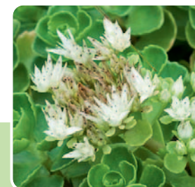
Oben: S. telephium Matrona, rechts: S. floriferum 'Weihenstephaner Gold' unten: S. reflexum 'Angelina', rechts: S. spurium 'Album Superbum'