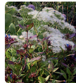
Sedum-Dolden strahlen Ruhe aus

Sedum kamtschaticum , in Kamtschatka, Japan und Sibirien beheimatet, besitzt die wohl größte Anpassungsfähigkeit an den Standort. Aus ihren bis 20 cm hohen Trieben webt sie in Sonne und Schatten frischgrünen Matten. Im Juli und August stehen Trugdolden orangegelber Blütensternchen darüber. Etwas heller wirkt das Laub bei Sedum kamtschaticum var. ellacombianum , das sich mit zitronengelben Blüten schmückt. Im Gegensatz zur Art geht sie kahl durch den Winter. Die Sorte 'Variegatum' gefällt durch graugrünes Laub mit cremegelbem Rand, zu dem die gelborange Blüten wunderbar passen. Sedum floriferum aus Nordost-China wurde früher als Varietät von Sedum kamtschaticum geführt und sieht ihr auch ähnlich, wirkt aber etwas zierlicher. Von ihr gibt es die Sorte 'Weihenstephaner Gold', die sich als idealer Bodendecker bewährt hat.