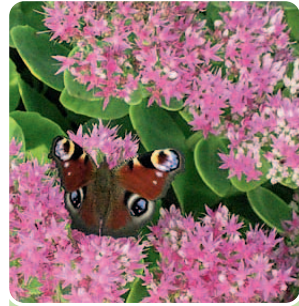
Auch Schmetterlinge lieben Sedum

Amerika hat seine Kakteen, Afrika seine Euphorbien und wir? Wir haben Sedum! Je nach Art auch Fetthenne und Mauerpfeffer genannt. Zwar besitzen sie keine Stacheln oder Dornen, aber skurril sind sie auch. Dickfleischig wie ihre exotischen Kollegen speichern sie Wasser für Dürrezeiten in Blättern und Trieben. So sind sie hervorragend angepasst an trockene und karge Standorte, besiedeln Ritzen und Fugen, machen sich auf Kiesbeeten und Dächern breit. Als Lebenskünstler kommen sie mit wenig aus und stecken trotzdem voller Gesundheit und Lebenskraft.