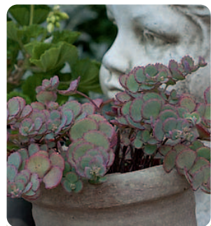
Viel geliebt: Das Oktoberle

● Sedum lieben warme, sonnige, trockene Plätze. Sedum kamtschaticum und Sedum hybridum können mit frischen Böden umgehen. Sedum spurium und Sedum spathulifolium halten es