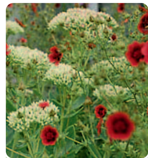
Verträglicher Nachbar Fetthenne

Sanfter wirkt Sedum cyaneum aus Ostasien, mit graugrünen, ganzrandigen Blättchen und feinen rosa Blütendöldchen. Es bildet dichte 10 cm hohe Polster. 'Rosenteppich' ist eine karminrosa Auslese von ihm. Sedum ewersii aus dem Himalaya bezeichnete Karl Foerster als „herrlichen Polsterschatz, von äußerster Lebensfähigkeit und Ausdauer“. Das gilt auch heute noch, vorausgesetzt es steht vollsonnig und trocken. Dann wartet es mit rosa Blüten über graugrünem, rosa überlaufenem Laub auf. Sedum spathulifolium zählt zu den wenigen nordamerikanischen Arten. Seine fleischigen Rosetten in Grüngrau wirken etwas fremdartig. Bei 'Purpureum' sind sie rötlich überlaufen, 'Red Raver' trägt Rot und 'Capo Blanco' schmückt sich mit Silbergrau. Erschöpft ist die Zahl der Steingarten-Sedum damit noch lange nicht. Unter den 500 Arten weltweit gibt es viele reizvolle Schätze, die zum Ausprobieren und Sammeln verleiten.